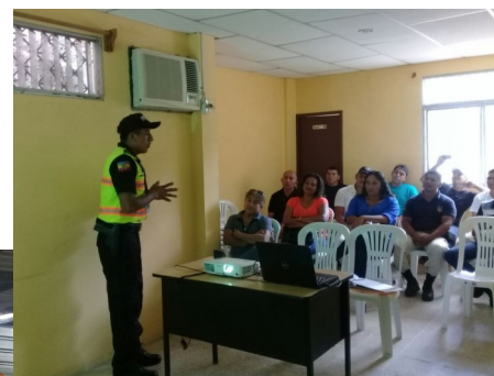
GEDEON CIA. LTDA.