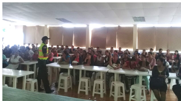
IDEAL CIA. LTDA.