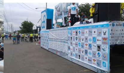
Arriba los auspiciantes y el desarrollo de la carrera 5k “Yo vivo sin drogas”.