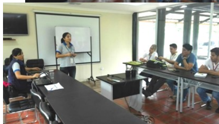
Nuestros capacitadores dictaron este importante taller en Santo Domingo de los Tsáchilas.