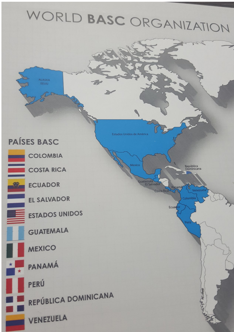
BASC está presente en 11 países de América y otros varios están en proceso de formar parte de la Organización. El actual Presidente de WBO es el costarricense Álvaro Alpizar, quien visitó Ecuador en Noviembre del 2015.

A la fecha, los cuatro capítulos regionales que conforman BASC ECUADOR suman 643 empresas afiliadas y 565 empresas certificadas, lo que nos posiciona como el segundo capítulo más grande de WBO, después de Colombia. Además hemos sido por dos años consecutivos el país con mayor crecimiento a nivel mundial. WBO tiene un total de 3.000 empresas certificadas.