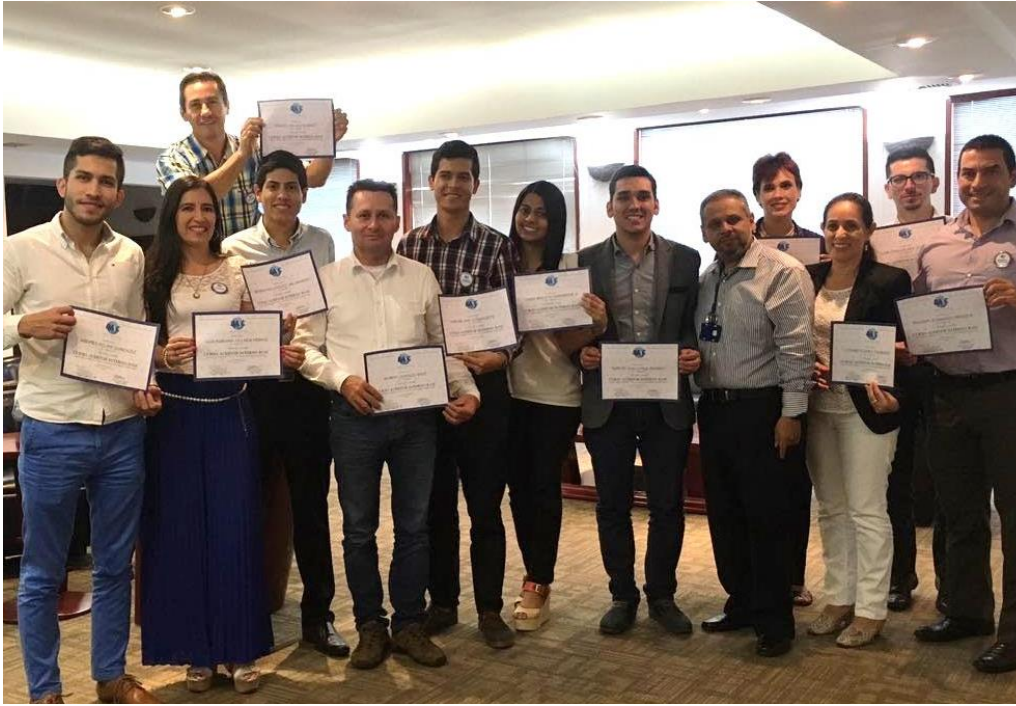
CURSO DE AUDITOR INTERNO BASC